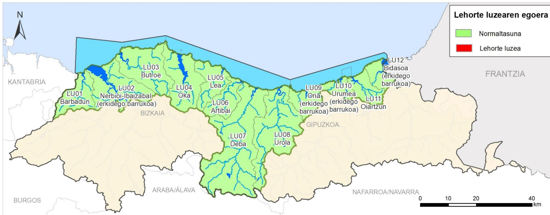
LEHORTE LUZEA EGOERAREN ADIERAZLEA