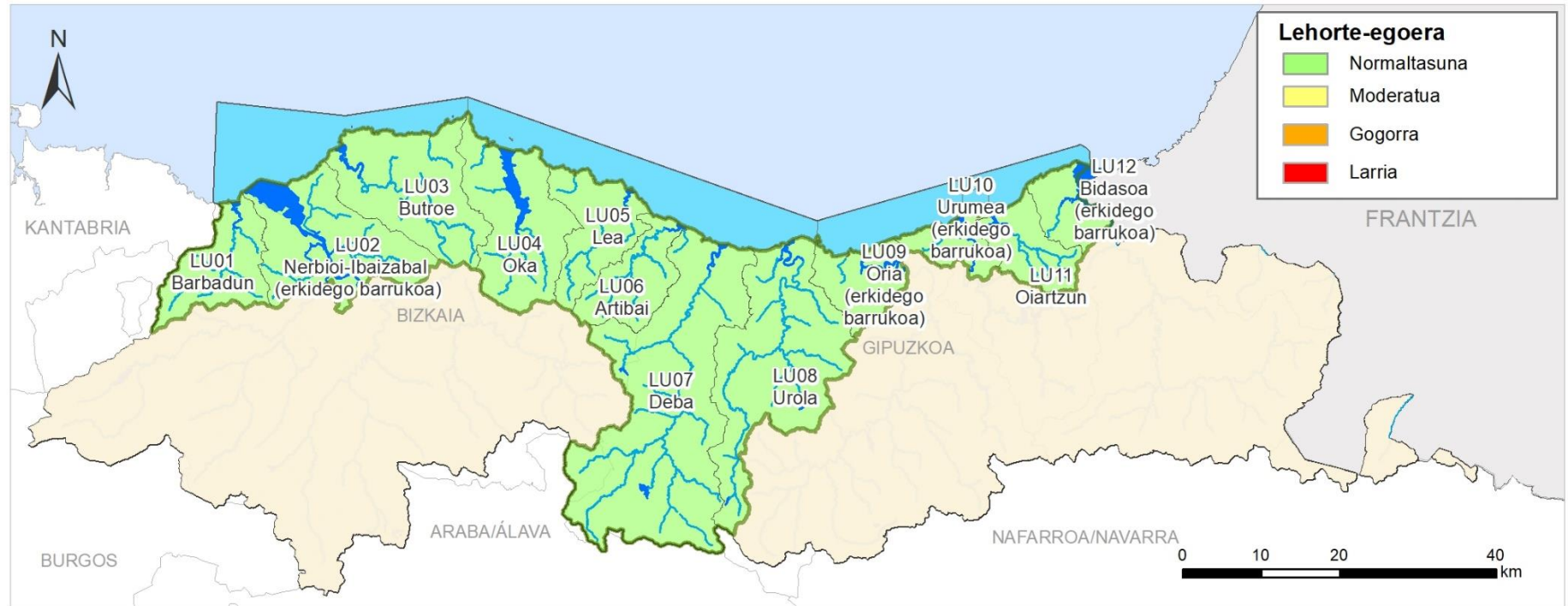
LEHORTE EGOERAREN ADIERAZLEA