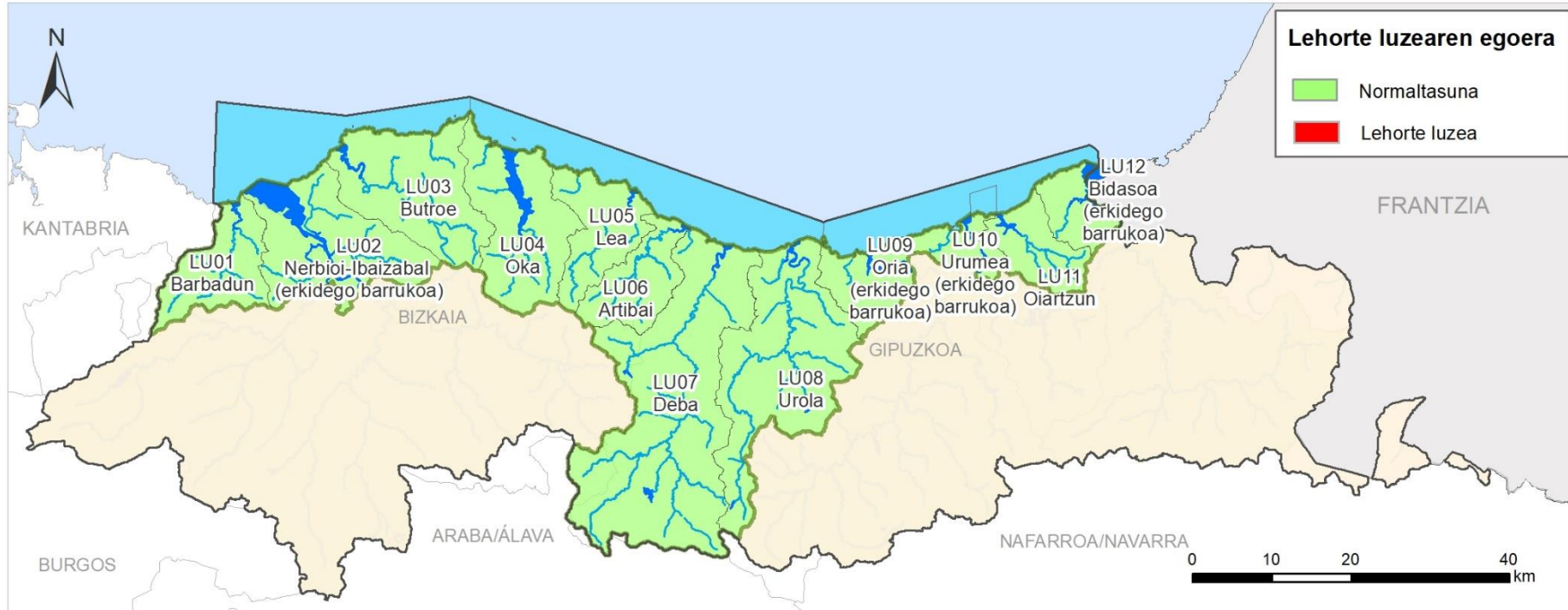
LEHORTE LUZEA EGOERAREN ADIERAZLEA